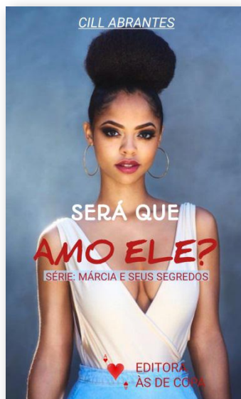
SERA QUE AMO ELE?

Outros livros publicados pela ÀS DE COPA totalmente gratis, leia ou baixe AQUI