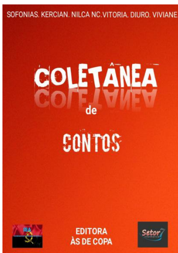
COLETANEA DE CONTOS VOL. 1