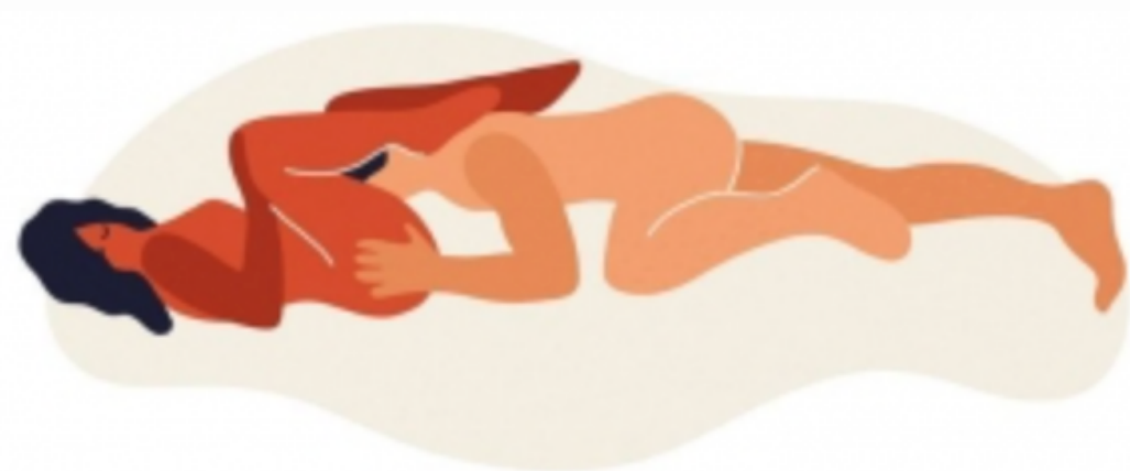
3. David Coperfield